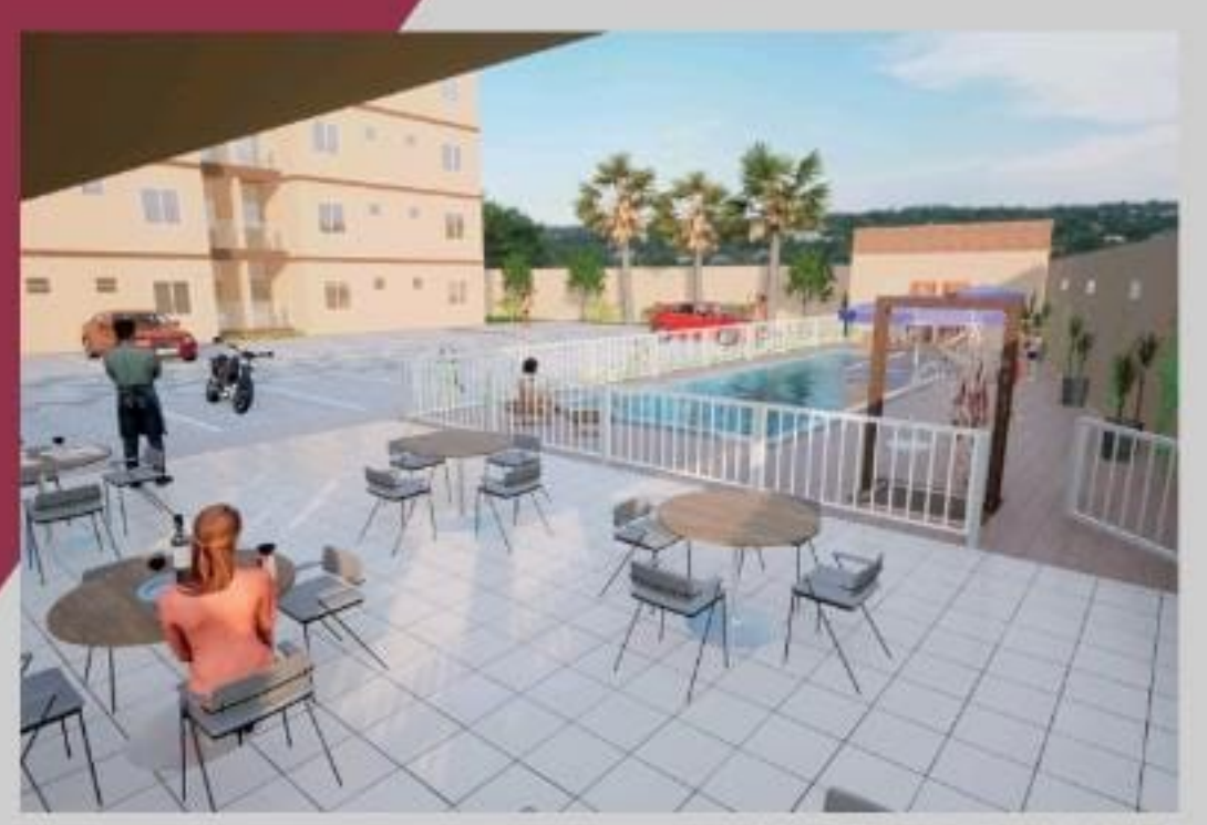
IMAGENS MERAMENTE ILUSTRATIVA